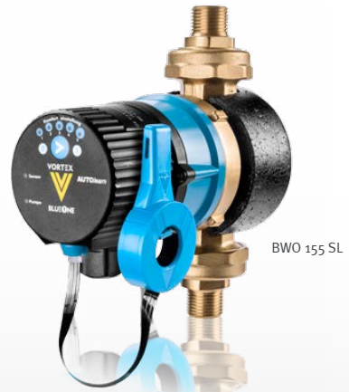
BWO 155 SL

Darüber hinaus passen die Pumpenmotoren auf alle markt-gängigen Pumpengehäuse!