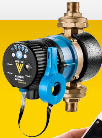
BWO 155 SL CONNECT